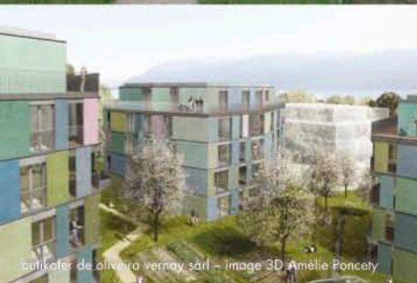
butikofer de oliveira vernay sarl - image 3D Amelie Poncety

Rdv: Devant l'entrée de l'immeuble, chemin de Bérée 26b